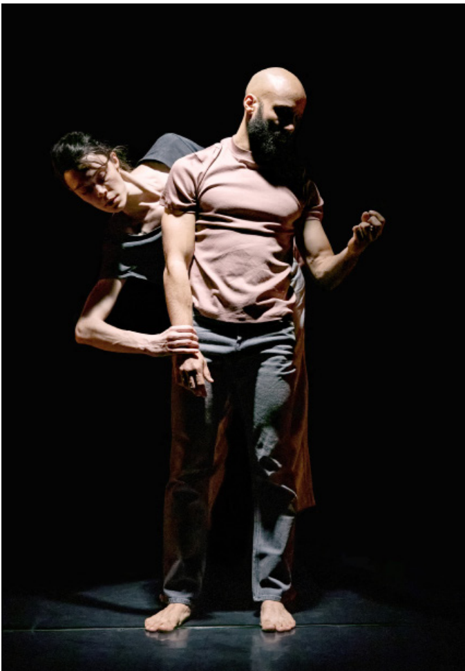
Abysses, Le Scribe, 2021

Logos est la première pièce de la compagnie. Elle remporte le prix du jury aux Hiveroclités en 2016 au CDCN les Hivernales. Cette création a été jouée en saison dans des scènes phares de la Région Sud et au-delà du territoire : le CCN d'Aix en Provence, le Ballet National de Marseille et l'Institut de monde arabe l'ont notamment accueilli. En juillet 2021, les pièces Logos et Abysses sont présentées au festival d'Avignon OFF (théâtre Golovine). La même année, Game of Dance , une performance en extérieur est créée à l'occasion du festival Un Air de Danse #1 organisé par le Ballet Preljocaj. Le spectacle, Yalla, my friends , voit le jour en février 2023 au CCN d'Aix-en-Provence, partenaire et coproducteur de ce projet. La compagnie Le Scribe bénéficie du soutien de la DRAC Paca, de la Région Sud, du Département 13 et de la ville d'Aix-en-Provence.